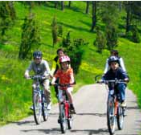
Entdecken Sie auf unseren Routen den Landkreis neu!

Zu einem herausragenden Projekt ist die Vermarktung des Juradistl-Lamms im Oberpfälzer Jura geworden. In Zusammenarbeit mit Hüteschäfern, Gastronomen, Metzger und der Firma Jura-Fleisch entsteht ein Produkt, das kulinarischen Genuss und Naturschutz verbindet.