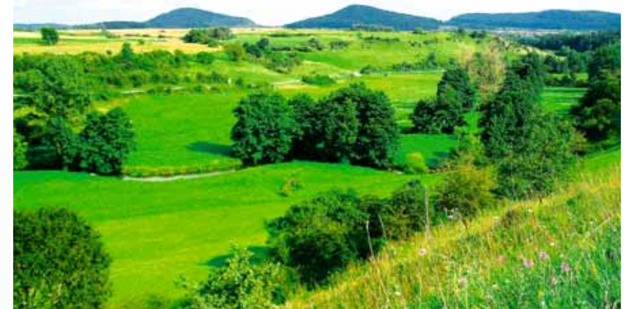
Landschaftspflegeverband und Landwirte kümmern sich gemeinsam um den Erhalt unserer Kulturlandschaft.

Auch Streuobstwiesen sind typisch für den Landkreis Neumarkt i.d.OPf. Bei kaum einem anderen Landschaftselement vereinen sich wertvoller Lebensraum, gesunde Nahrung und reizvoller Erholungsraum so eindrucksvoll. Viele neue Streuobstwiesen und Obstbaumreihen mit über 2.500 Neupflanzungen konnten bis jetzt verwirklicht werden und bereichern das Landschaftsbild unserer Heimat. Mit der Neuanlage naturnaher Lebensräume vernetzen wir die bestehenden Biotop und schaffen so ein landkreisübergreifendes Biotopverbundsystem.