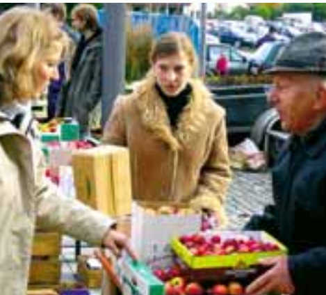
Besuchen Sie unsere regionalen Obstmärkte!