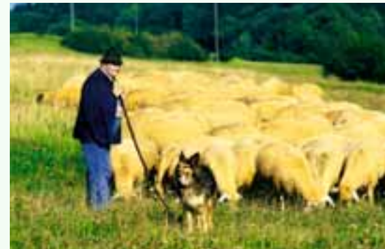
Schafe sind unverzichtbar bei der Landschaftspflege.