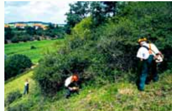
Entbuschungen sichern die artenreichen Kalkmagerrasen.