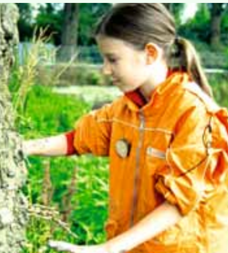
Erleben Sie Natur mit allen Sinnen!

Machen Sie mit – wir freuen uns auf Sie! Gerne schicken wir Ihnen Informationsmaterial zu unseren Angeboten.