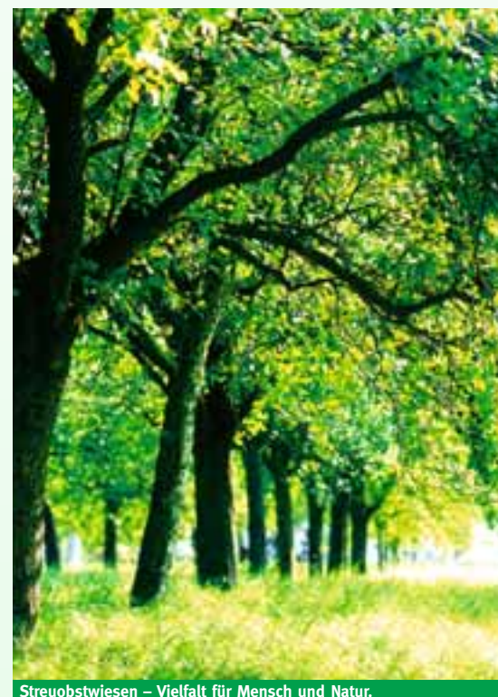
Streuobstwiesen – Vielfalt für Mensch und Natur.