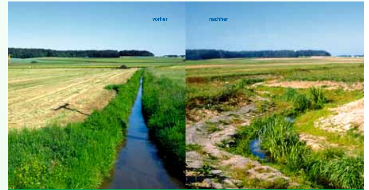
Renaturierung der Sulz bei Sondersfeld: Aus einem begradigten Rinnsal wurde wieder ein Bach mit natürlichem Verlauf.

Landschaftspflege und Landwirte – eine starke Partnerschaft, von der beide Seiten profitieren. Für den Landschaftspflegeverband sind die Landwirte zuverlässige Partner bei der Landschaftspflege. Für die Landwirte sind die Pflegemaßnahmen eine zusätzliche Einnahmequelle: In den letzten zehn Jahren zahlte der Landschaftspflegeverband Neumarkt i.d.OPf. mehr als 1,5 Millionen Euro direkt an die Landwirte für ihren Arbeits- und Maschineneinsatz. Darüber hinaus berät der Landschaftspflegeverband seine Partner im Hinblick auf umweltbezogene Förderprogramme oder Alternativen in der Betriebsführung, um deren Einkommenssituation zu verbessern. Die Pflege und der Erhalt unserer Kulturlandschaft wiederum ist für den Landschaftspflegeverband nur durch die Unterstützung der Landwirte möglich.